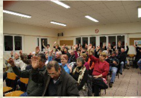
Lors du vote →

L'association se donne désormais le temps de la réflexion pour l'utilisation des ces fonds. Un verre de l'amitié a bien sûr clôturé la réunion.